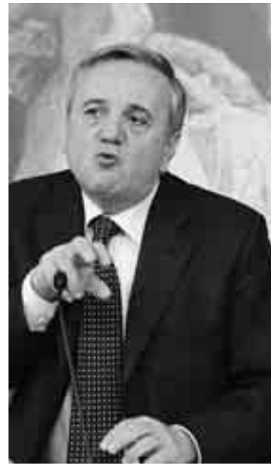
Il ministro del Lavoro, Maurizio Sacconi, ieri a palazzo Chigi, mentre illustra il Libro bianco sul Welfare

Licenziamenti. Il Libro bianco prevede il rilancio